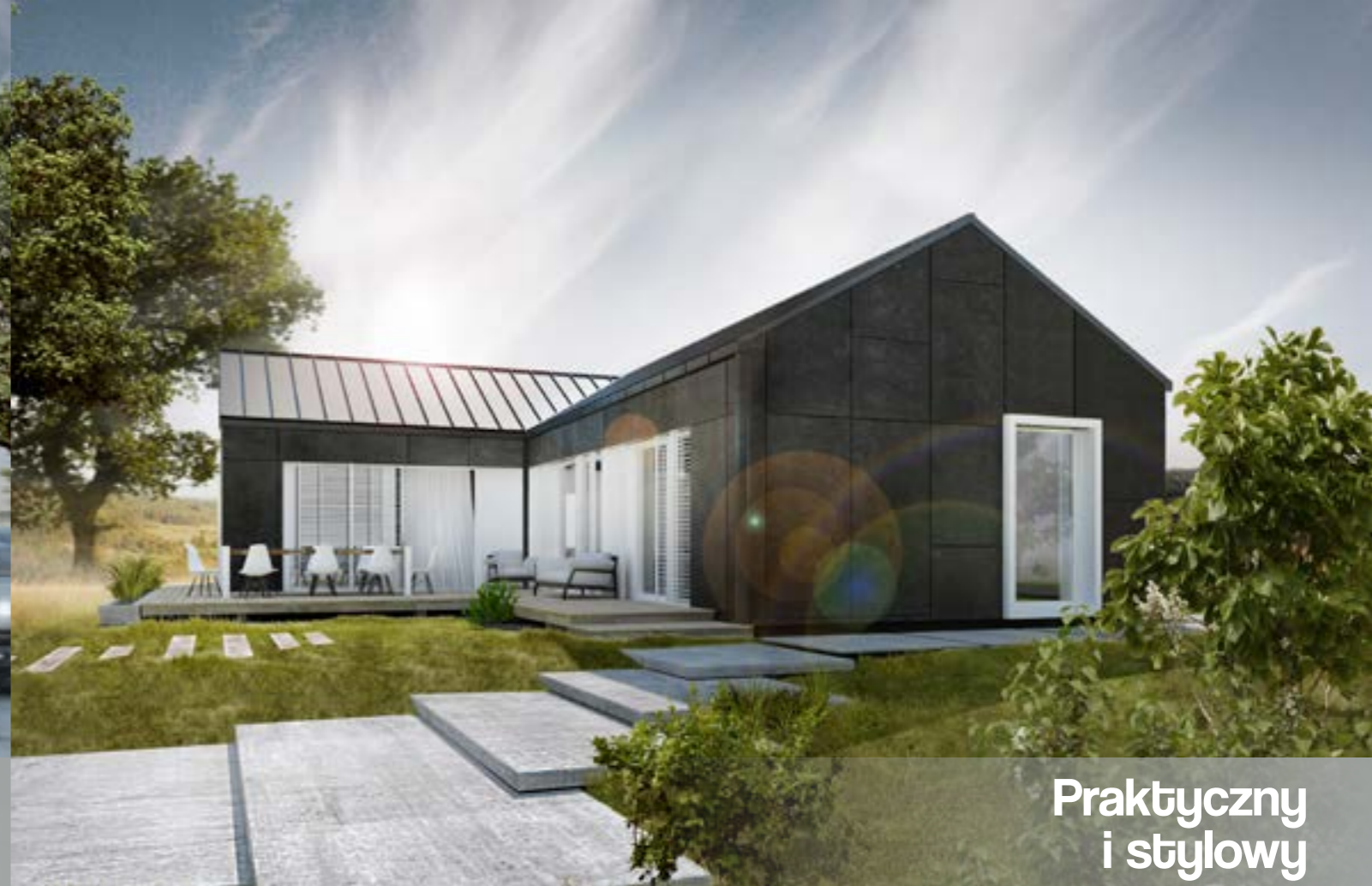
Praktyczny i stylowy