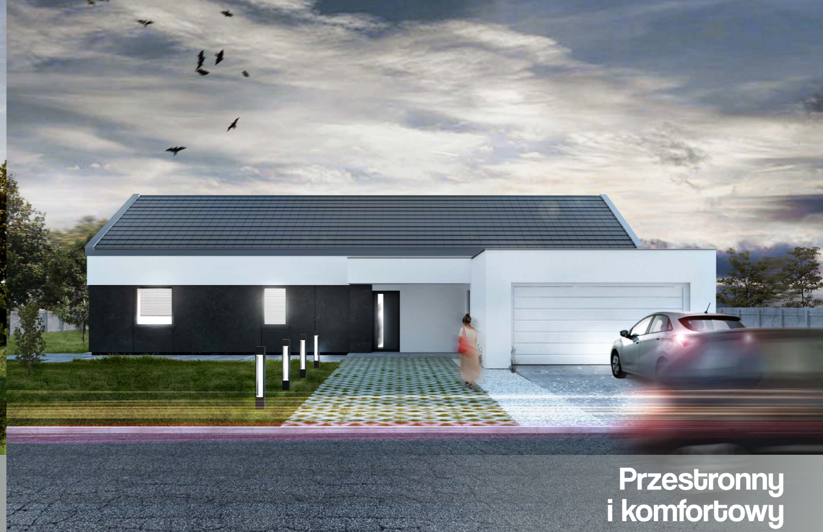
Przestronny i komfortowy