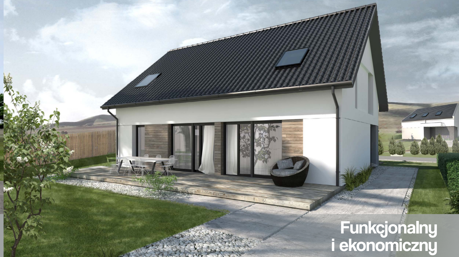
Funkcjonalny i ekonomiczny